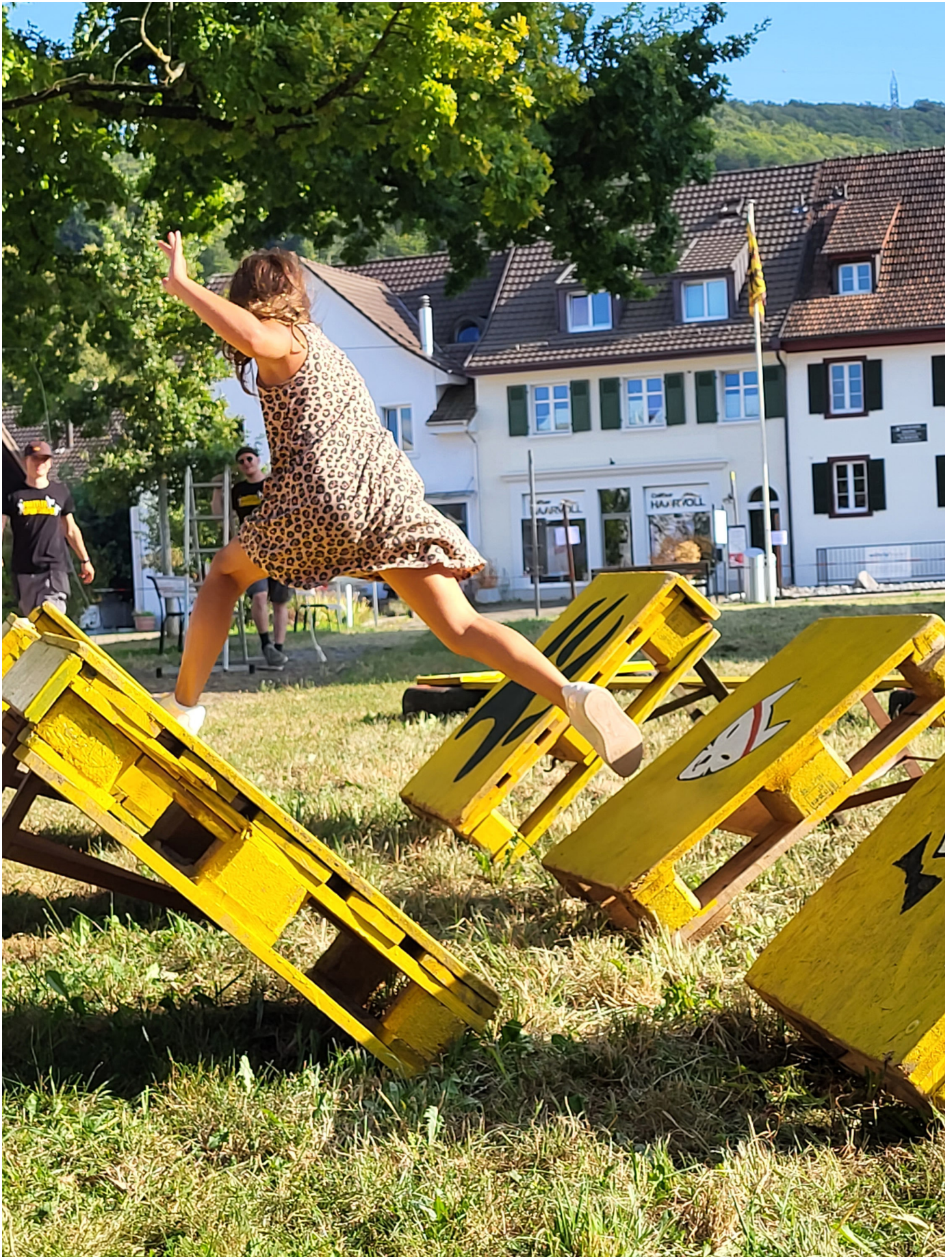
Spiel und Sport an der Prattler Sportnacht