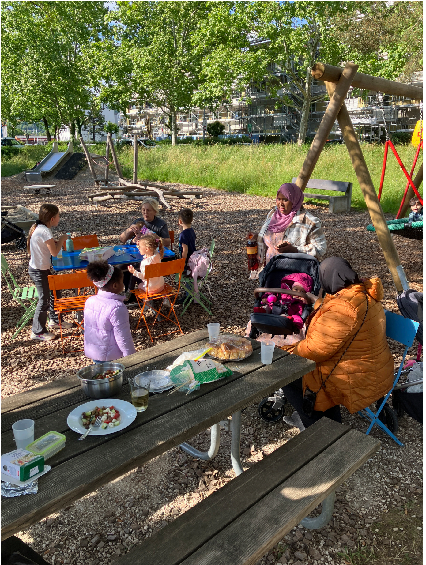
Der neue Spielplatz in der Längi