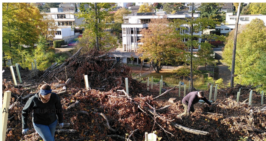
Abb. 2: Erfolgreiche Baumpflanzungen am Naturschutztag.

Bei schönem Herbstwetter trafen sich am 18. Oktober 2025 rund 20 engagierte Personen, um gemeinsam etwas für die Natur zu tun. Am diesjährigen Naturschutztag stand der Waldrand im Mittelpunkt. Das Forstrevier Schauenburg hat beim Waldstück Sunnerai Ende August einen Sicherheitsholzschlag durchführen müssen, da von den geschwächten und zum Teil abgestorbenen Bäumen eine grosse Gefahr für die Schülerinnen und Schüler der angrenzenden Schulhäuser Erli 1 und 2 ausging. Zuerst wurde das Totholz zu Asthaufen zusammengetragen – wertvolle Lebensräume für viele Tiere und Pflanzen. Danach pflanzten die freiwilligen Helfer rund 150 heimische Baumarten wie Speierling, Elsbeere, Traubeneiche und Schneeballblättriger Ahorn. Diese Bäume fördern die Artenvielfalt und verschönern das Landschaftsbild. Bis diese Zukunftsbäume wieder Schatten spenden, wird es aber noch ein paar Jahre dauern.