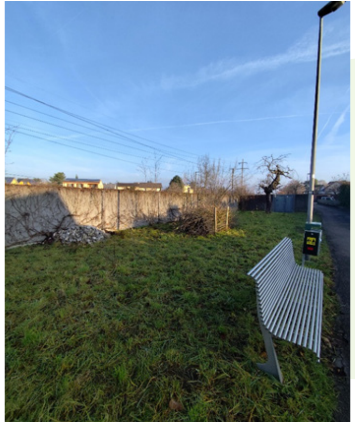
Abb. 8-11: Aufwertungsmassnahmen im Siedlungsgebiet.